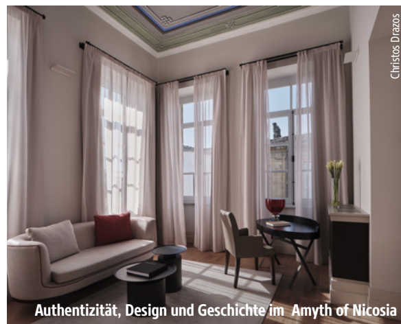
Authentizität, Design und Geschichte im Amyth of Nicosia