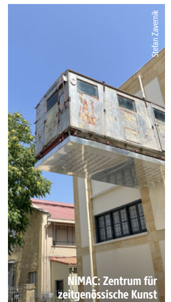
NiMAC: Zentrum für zeitgenössische Kunst

Nikosia – Zypriotische Küche; Beba Restaurant, Pindarou 2a, Nikosia Nikosia – Zypriotische Fusionsküche; Amyth Kouzina, Patriarchou Gregoriou Street 29, Nikosia Paphos – Zypriotische Küche; Ouzeri, Poseidons Av 12, 8042 Pafos