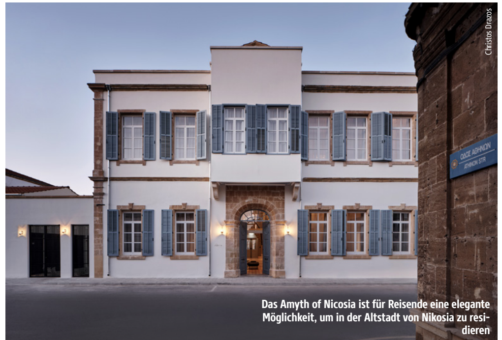
Das Amyth of Nicosia ist für Reisende eine elegante Möglichkeit, um in der Altstadt von Nikosia zu residieren

Zypern hat auch an der Küste kulturell viel zu bieten – allen voran Paphos. Neben dem venezianischen Kastell im Hafen zählen die römischen Villen mit farbenprächtigen Mosaiken und die Königgräber zum Weltkulturerbe der UNESCO. Ca. 15 Kilometer entfernt liegt der berühmte Felsen Petra tou Romiou, wo der Legende nach die Göttin Aphrodite dem Meer entstieg. Die Thanos Group betreibt in Paphos das Almyra-Hotel, ein Design-Icon direkt an der Uferpromenade, umgeben von Olivenbäumen und mediterraner Pflanzenpracht. Puristische Architektur, großzügige Panoramafenster und ein elegantes Innendesign rücken das Meer und die Küstenlandschaft ins Zentrum. Die Kyma-Suiten bieten nicht nur grandiose Ausblicke, sondern auch akustischen Luxus. Die stylishen Bungalows liegen nur wenige