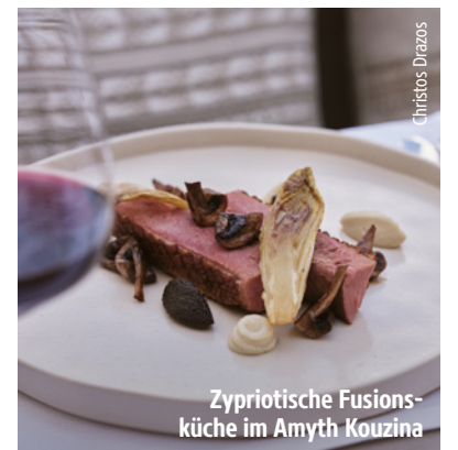
Zypriotische Fusionsküche im Amyth Kouzina