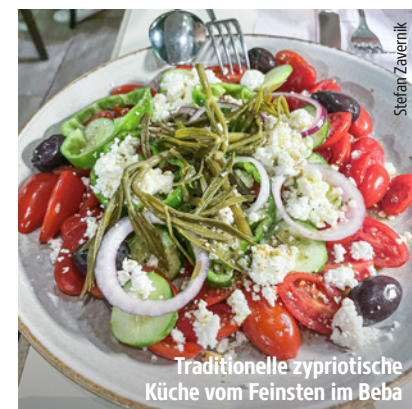
Traditionelle zypriotische Küche vom Feinsten im Beba