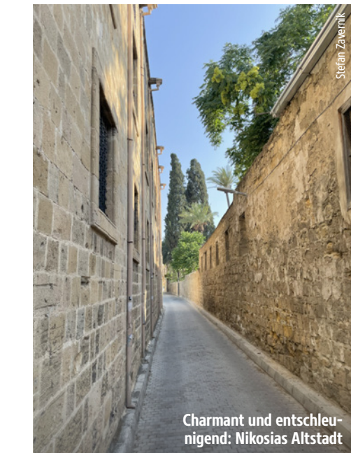
Charmant und entschleunigend: Nikosias Altstadt

Nikosia ist die letzte geteilte Hauptstadt Europas – eine Teilung, die zwar nicht laut zur Schau getragen wird, aber allgegenwärtig ist. 1974 führten politische Spannungen zur Trennung der Insel durch eine UN-Pufferzone. Wer heute an der Ledra-Straße die Grenze passiert, betritt eine andere Welt. Im Norden findet man eine unveränderte Atmosphäre vor: wenig Renovierung, dafür viel Ursprünglichkeit. Die osmanische Karawanserei Büyü