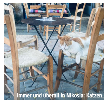
Immer und überall in Nikosia: Katzen

Meter vom Meer entfernt und bringen das Rauschen der Brandung direkt ins Zimmer. Auf der privaten Dachterrasse lassen sich spektakuläre Sonnenuntergänge erleben. Kulinarisch lockt das Ouzeri am Wasser mit landestypischer Küche: Mezes, griechische Klassiker und fangfrischer Fisch. Ein wunderbarer Abschluss für eine Reise, die tief in die Kultur Zyperns eintaucht.